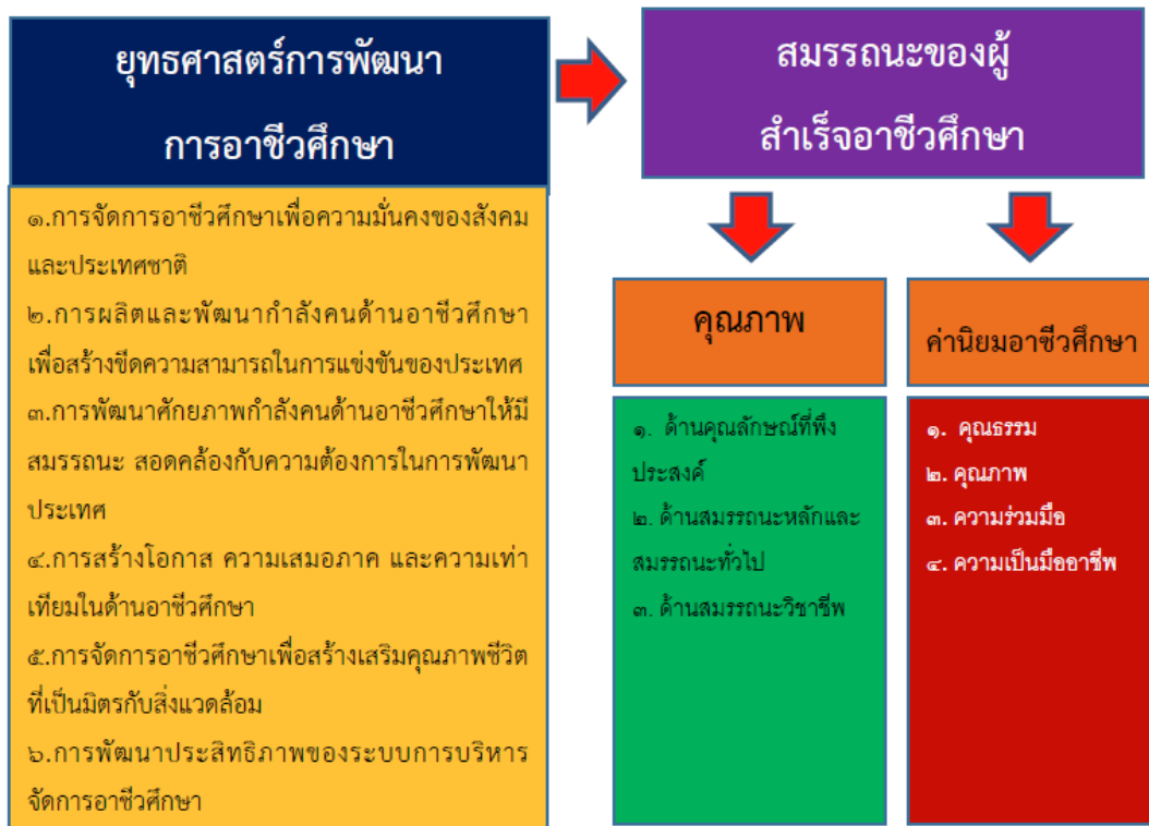
กรอบแนวคิดแผนพัฒนาการอาชีวศึกษา พ.ศ. 2560 – 2579