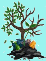
Save The Planet