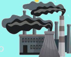
Manufacturing & Pollution