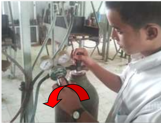
รูปที่ 2.78 แสดงการคลายสกรูปรับความดันแก๊ส

9. คลายสกรูปรับความดันแก๊สอะเซทิลีนและแก๊สออกซิเจนที่อุปกรณ์ปรับความดัน ดังแสดงในรูปที่ 2.78