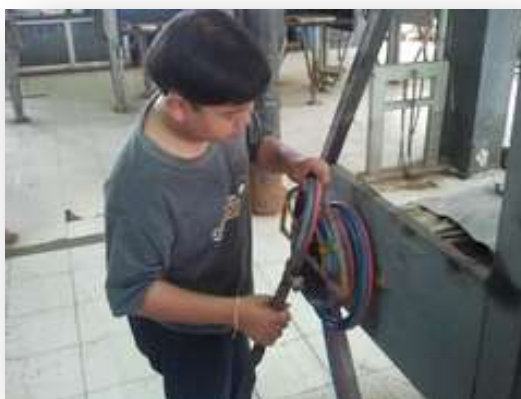
รูปที่ 2.80 แสดงการเก็บม้วนสายยางเชื่อมแก๊สไว้ที่แขวน