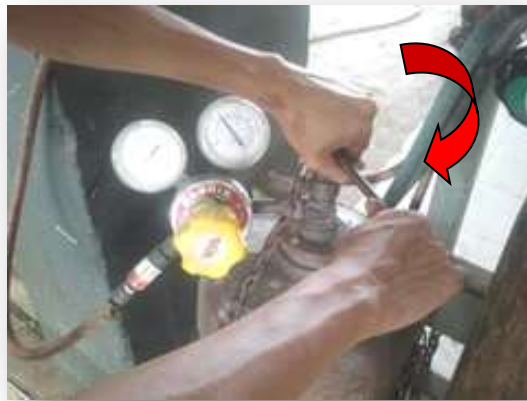
รูปที่ 2.76 แสดงการปิดวาล์วแก๊สอะเซทิลีน

8. ปิดวาล์วแก๊สอะเซทิลีนและปิดวาล์วแก๊สออกซิเจนที่หัวเชื่อมต่อจากนั้นจึงปิดวาล์วแก๊สอะเซทิลีนและแก๊สออกซิเจนที่หัวถัง ดังแสดงในรูปที่ 2.76 และ 2.77