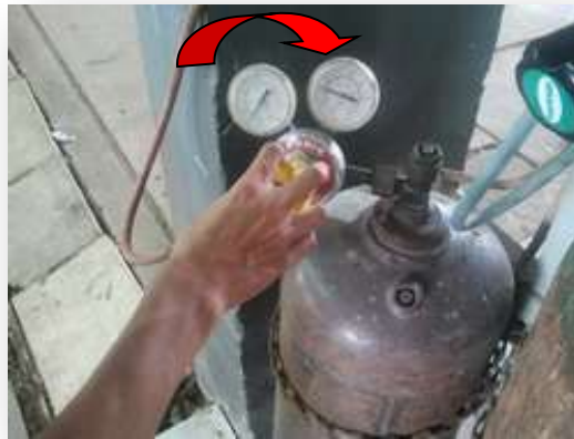
รูปที่ 2.70 แสดงการปรับความดันแก๊สอะเซทิลีน

3. ปรับความดันที่อุปกรณ์ปรับความดันแก๊สอะเซทิลีนไม่เกิน 15 ปอนด์ต่อตารางนิ้ว (psi) และแก๊สออกซิเจน 25-30 ปอนด์ต่อตารางนิ้ว (psi) ดังแสดงในรูปที่ 2.70 และ 2.71