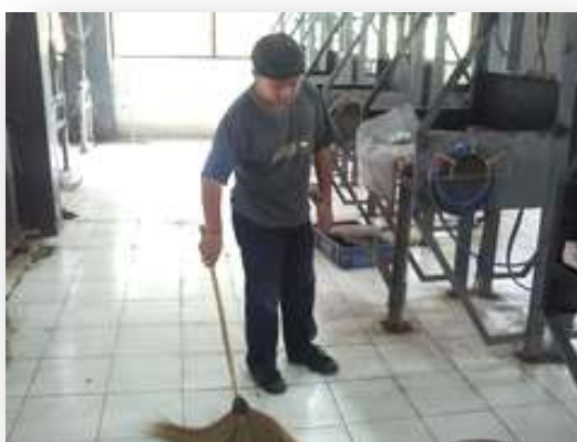
รูปที่ 2.81 แสดงการทำความสะอาดบริเวณ