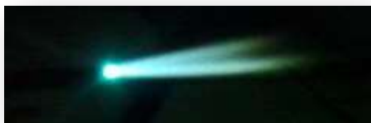
รูปที่ 2.75 แสดงการปรับเปลวออกซิไดซิงเฟรมหรือเปลวเพิ่ม

7. ถ้าปรับเพิ่มแก๊สออกซิเจนเดิมเข้าไปอีก จะทำให้กรวยไฟชั้นในแหลมและมีเสียงดัง เรียกเปลวนี้ว่า ออกซิไดซิงเฟรมหรือเปลวเพิ่ม ดังแสดงในรูปที่ 2.75