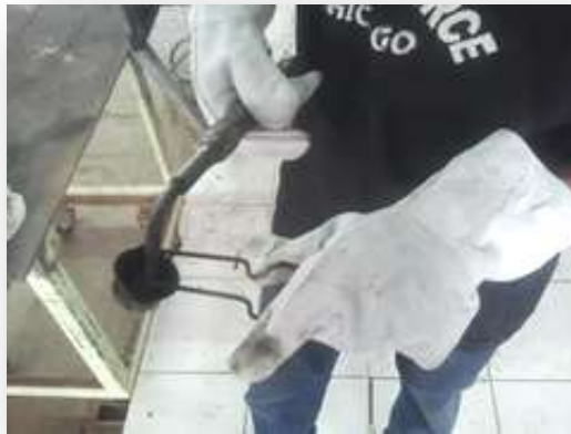
รูปที่ 2.72 แสดงการจุดด้วยที่จุดเปลวไฟ

4. เปิดวาล์วที่หัวทอร์ชเชื่อมของแก๊สอะเซทิลีน โดยประมาณหรือพอมิแรงดันแก๊ส แล้วจุดด้วยที่จุดเปลวไฟ (Spark Lighter) ดังแสดงในรูปที่ 2.72