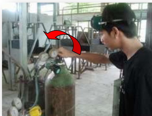
รูปที่ 2.69 แสดงการเปิดวาล์วที่ถังแก๊สออกซิเจน