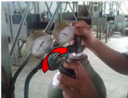
รูปที่ 2.71 แสดงการปรับความดันแก๊สออกซิเจน