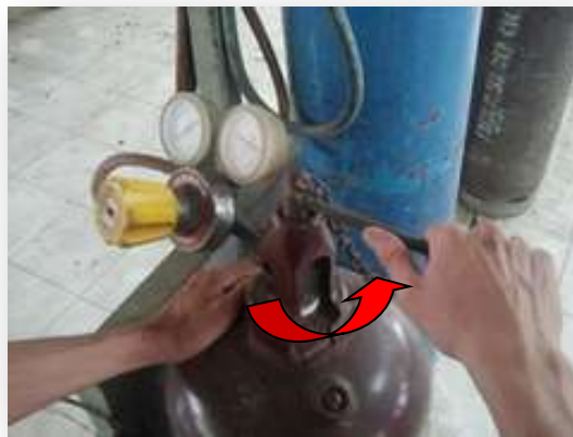
รูปที่ 2.68 แสดงการเปิดวาล์วที่ถังแก๊สอะเซทิลีน