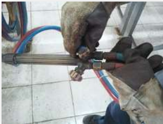
รูปที่ 2.79 แสดงการเปิดวาล์วที่หัวเชื่อมแก๊ส

10. เปิดวาล์วที่หัวเชื่อมเพื่อให้แก๊สอะเซทิลีนและแก๊สออกซิเจนไหลออกจากสายเชื่อม โดยดูว่าเข็มที่เกจวัดความดันต่ำลงที่ตำแหน่งศูนย์