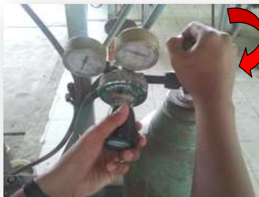
รูปที่ 2.77 แสดงการปิดวาล์วแก๊สออกซิเจน