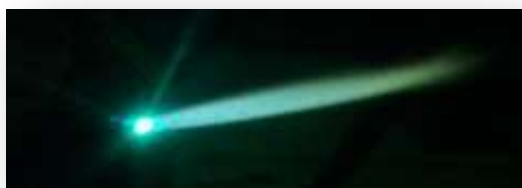
รูปที่ 2.74 แสดงการปรับนิวทรัลเฟรมหรือเปลวกลาง

6. ปรับเพิ่มออกซิเจนไปเรื่อย ๆ จนเปลวไฟชั้นกลางหายไปเหลือแต่กรวยไฟชั้นในเท่านั้นมีลักษณะเปลวเป็นกรวย 2 ชั้น เรียกเปลวนี้ว่า นิวทรัลเฟรมหรือเปลวกลาง ดังแสดงในรูปที่ 2.74