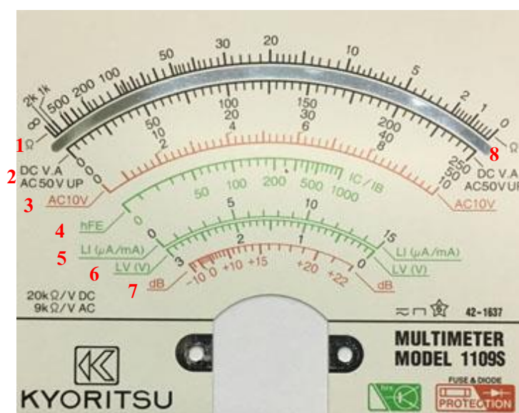
รูปที่ 2.2 แสดงสเกลหน้าปัดของมัลติมิเตอร์แบบแอนะล็อก