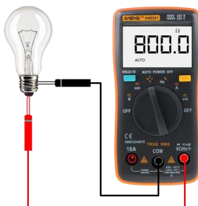
(ง) การใช้มัลติมิเตอร์แบบดิจิตอลวัดค่าความต้านทาน

รูปที่ 2.9 แสดงการใช้งานมัลติมิเตอร์แบบดิจิตอล