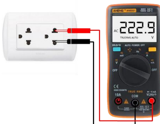
(ก) การใช้มัลติมิเตอร์แบบดิจิทัลวัดแรงดันไฟฟ้ากระแสสลับ

มัลติมิเตอร์เกือบทุกรุ่นที่อยู่ทั่วไปตามท้องตลาดจะมี Rotary Switch หรือ Function Switch ซึ่งตรงนี้ถือเป็นสิ่งที่สำคัญมากในการใช้งานมัลติมิเตอร์ในการวัดค่าต่างๆ แต่ทุกครั้งจะต้องหมุน Rotary Switch ไปให้ตรงกับตำแหน่งที่เราต้องการจะวัด การใช้สายวัดก็สำคัญมากทุกครั้งที่ทำกรวัด ควรตรวจสอบก่อนเสมอว่าเสียบและวัดตรงกับขั้วรีเปล่า ซึ่งสายสีแดงจะอยู่ทางขั้วบวก (+) สีดำจะอยู่ทางขั้วลบ (-)