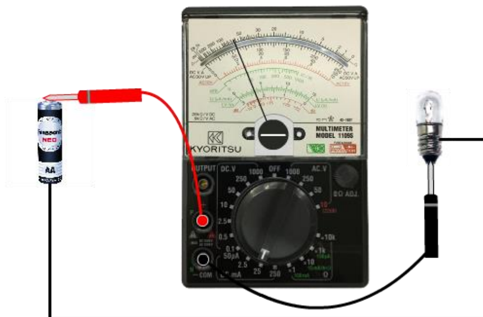
รูปที่ 2.5 แสดงการใช้มัลติมิเตอร์แบบแอนะล็อกวัดกระแสไฟตรง

การใช้มัลติมิเตอร์แบบแอนะล็อกวัดกระแสไฟตรง โดยปรับสวิตช์เลือกย่านวัดไปที่ DCmA มัลติมิเตอร์ชนิดแอนะล็อกรุ่นมาตรฐาน จะมีย่านวัดกระแสไฟตรงทั้งหมด 4 ย่านวัดได้มีสเกล คือ ย่าน 50 \mu A, 2.5 mA, 25 mA และ 250 mA (0.25 A)