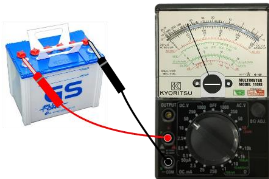
รูปที่ 2.4 แสดงการใช้มัลติมิเตอร์แบบแอนะล็อกวัดแรงดันไฟฟ้ากระแสตรง

การใช้มัลติมิเตอร์แบบแอนะล็อกวัดแรงดันไฟฟ้ากระแสตรง โดยการปรับสวิตช์เลือกย่านวัดไปที่ DCV มีย่านวัดแรงดันไฟตรงทั้งหมด 7 ย่านวัดเต็มสเกล คือ ย่าน 0.1 V, 0.5 V, 2.5 V, 10 V, 50 V, 250 V และ 1,000 V