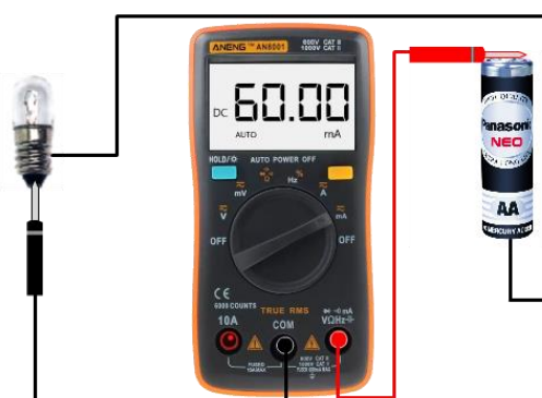
(ค) การใช้มัลติมิเตอร์แบบดิจิตอลวัดกระแสไฟตรง