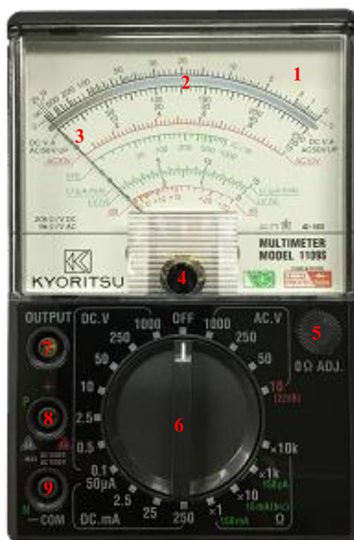
รูปที่ 2.1 แสดงส่วนประกอบของมัลติมิเตอร์แบบแอนะล็อก