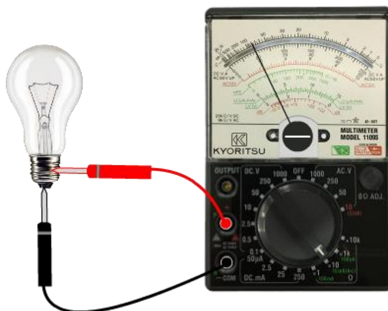
รูปที่ 2.7 แสดงการวัดค่าความต้านทานของหลอดไฟโดยการวัดย่านโอห์ม

รูปที่ 2.6 แสดงการปรับให้เข็มชี้ของมิเตอร์ชี้ที่ตำแหน่งศูนย์โอห์ม โดยการปรับสวิตช์เลือกไปย่านวัด \Omega ก่อนนำโอห์มมิเตอร์ไปใช้วัดตัวต้านทานทุกครั้ง ในทุกย่านวัดที่ตั้งวัดโอห์ม ต้องปรับแต่งเข็มชี้ของมิเตอร์ให้ชี้ค่าที่ 0 \Omega ก่อนเสมอ โดยช้อนปลายสายวัดทั้งสองเส้นของมิเตอร์เข้าด้วยกัน ปรับแต่งปุ่มปรับ 0 \Omega ADJ. จนเข็มชี้ของมิเตอร์ชี้ที่ตำแหน่ง 0 \Omega พอดี