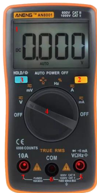
รูปที่ 2.8 ส่วนประกอบของมัลติมิเตอร์แบบดิจิทัล