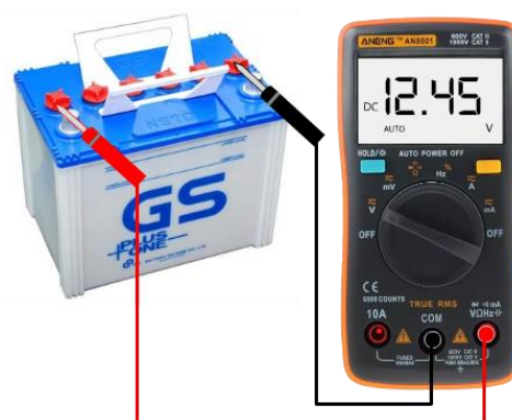
(ข) การใช้มัลติมิเตอร์แบบดิจิตอลวัดแรงดันไฟฟ้ากระแสตรง