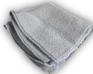
6.2.4 ผ้าสะอาด