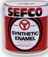
6.1.4 สีน้ำมัน