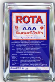
6.1.5 ทินเนอร์