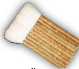
6.2.2 แปรงขนอ่อน (ขนกระต่าย)