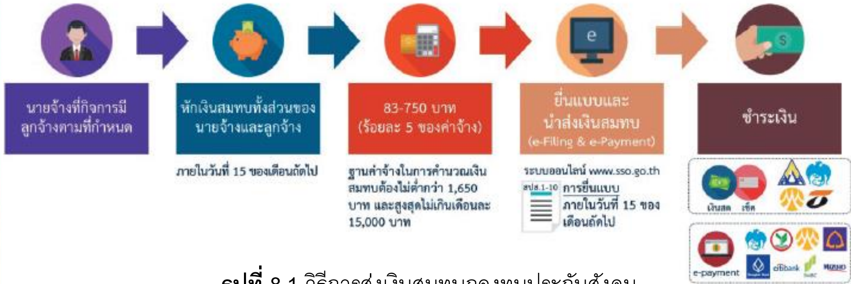
รูปที่ 8.1 วิธีการส่งเงินสมทบกองทุนประกันสังคม