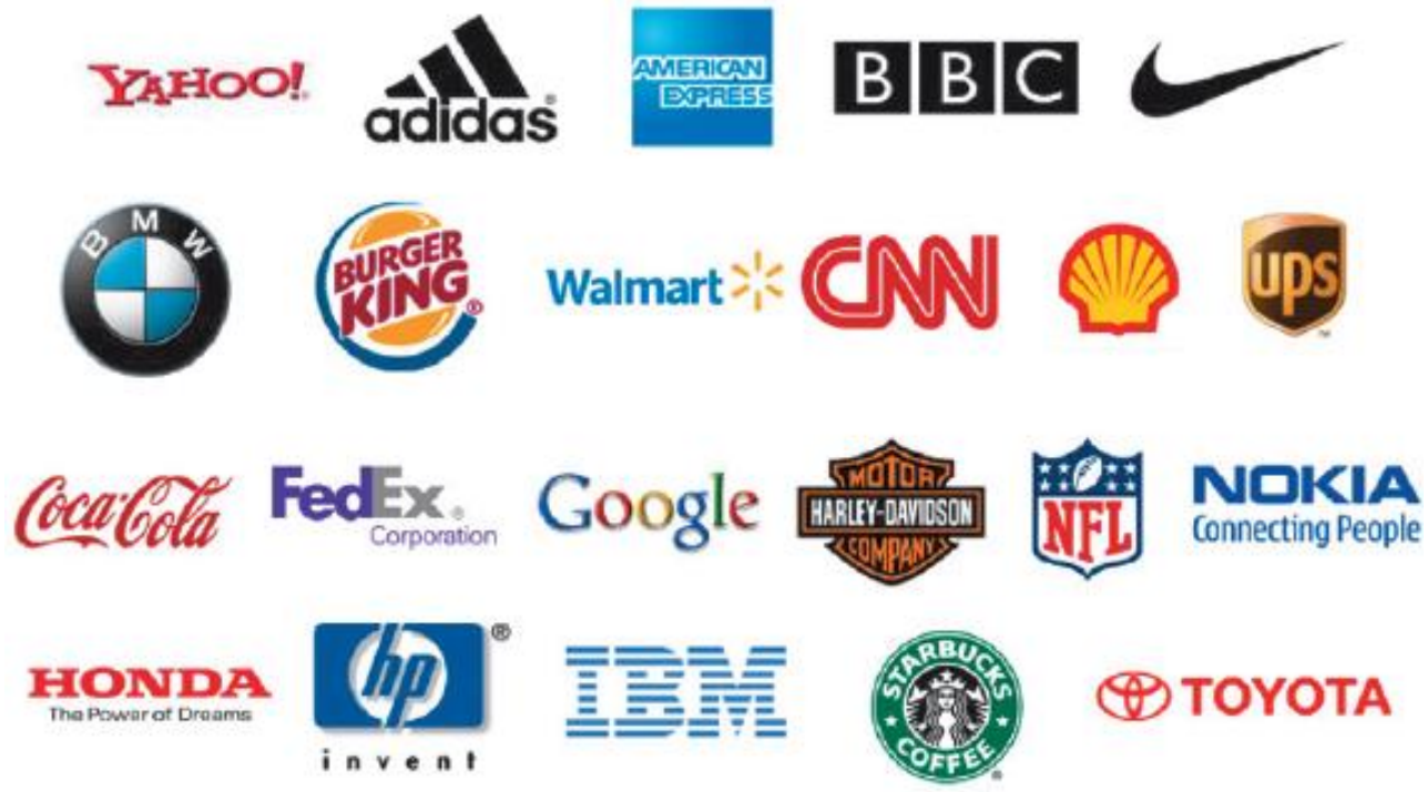
รูปที่ 8.5 ตัวอย่างเครื่องหมายการค้า