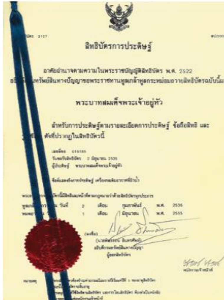
รูปที่ 8.4 ตัวอย่างสิทธิบัตรการประดิษฐ์