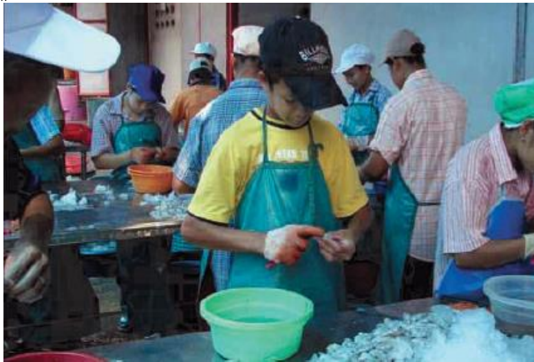
รูปที่ 8.2 การคุ้มครองแรงงานเด็ก “ห้าม” ใช้แรงงานเด็กที่มีอายุต่ำกว่า 15 ปี โดยเด็ดขาด