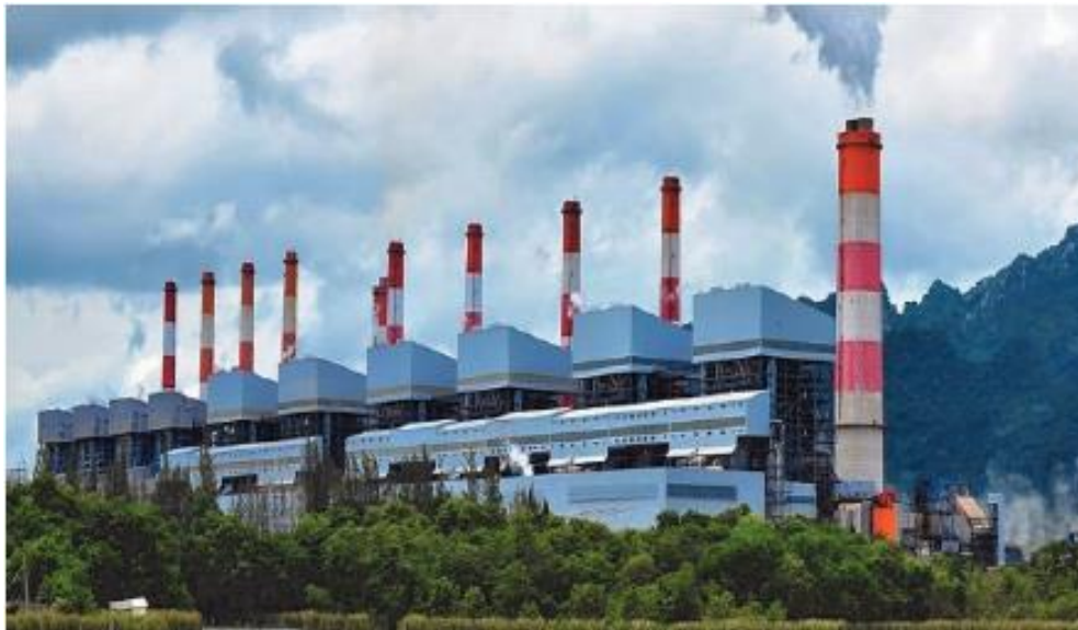
รูปที่ 8.3 โรงงาน