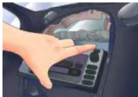
รูปที่ 6 ดึงเครื่องเสียงออกมาจากช่องใส่

6. ดึงเครื่องเสียงออกมาจากช่องใส่ สามารถใช้คีมปากแหลม คีบเอาไว้ที่ขอบเพื่อช่วยดึงออกมาได้ค่อย ๆ ดึงออกมาเบา ๆ และ ถ้าหากดึงออกมาไม่ได้ลองเช็คดูว่าลืมถอดสกรูตัวไหนหรือไม่