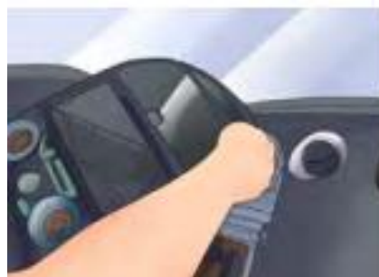
รูปที่ 4 ดึงชิ้นส่วนอื่น ๆ ที่สำคัญออก

4. ดึงชิ้นส่วนอื่น ๆ ที่สำคัญออก หากจำเป็นต้องดึงชิ้นส่วนอื่นออก ก่อนที่จะนำเครื่องเสียงออกมา ให้ทำการปลดสายไฟที่เชื่อมต่อออก ถ่ายรูปเอาไว้ว่าแต่ละสายเชื่อมต่ออย่างไร ป้องกันการลืมเวลาต่อกลับ