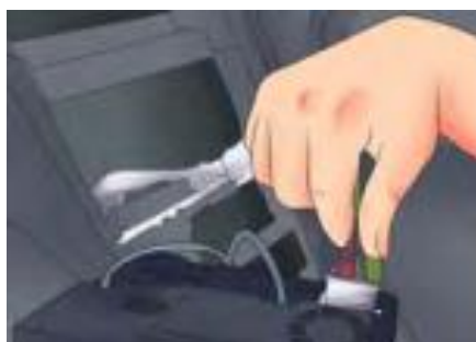
รูปที่ 13 ต่อสายดิน

5. ต่อสายไฟอื่น ๆ ต่อสายอากาศและหม้อแปลงเครื่องเสียง เข้ากับชุดสายไฟของรถยนต์ต่อสายเปลี่ยนสัญญาณที่เข้ากับระบบ เครื่องเสียงรถยนต์ได้ถ้าต้องการ