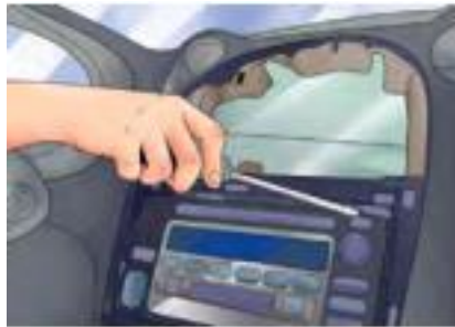
รูปที่ 5 ดึงชิ้นส่วนอื่น ๆ ที่สำคัญออก

6. ดึงเครื่องเสียงออกมาจากช่องใส่ สามารถใช้คีมปากแหลม คีบเอาไว้ที่ขอบเพื่อช่วยดึงออกมาได้ค่อย ๆ ดึงออกมาเบา ๆ และ ถ้าหากดึงออกมาไม่ได้ลองเช็คดูว่าลืมถอดสกรูตัวไหนหรือไม่