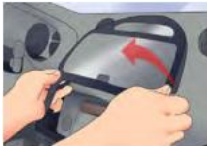
รูปที่ 3 ดึงกรอบที่ครอบตรงเครื่องเสียงเอาไว้ออก

3. ดึงกรอบที่ครอบตรงเครื่องเสียงเอาไว้ออก สำหรับรถบางคัน อาจต้องเอากรอบพลาสติกออกด้วย ส่วนใหญ่ทำได้ง่าย ๆ เมื่อแกะ จากล่างขึ้นบน