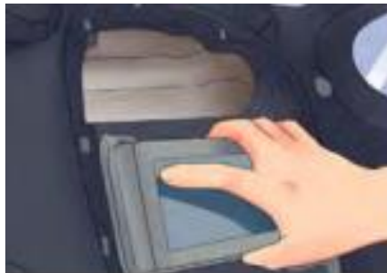
รูปที่ 15 ใส่เครื่องเสียงเข้าไปในช่อง

1. ใส่เครื่องเสียงเข้าไปในช่อง เมื่อใส่เข้าไปจนถึงตำแหน่งที่ถูกต้อง ควรจะได้ยินเสียงคลิก