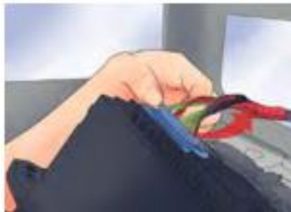
รูปที่ 8 ถ่ายรูปแบบการเชื่อมต่อสายไฟเข้ากับเครื่องเสียง

- ขั้นตอนต่อไปให้ปลดชุดสายไฟออก จะเป็นสายไฟที่ถูกมัดรวมกันเอาไว้และเชื่อมติดกัน ด้วยหัวพลาสติก โดยที่หัวพลาสติกจะมีปุ่มให้กดเข้าไปเพื่อคลายตัวล็อก