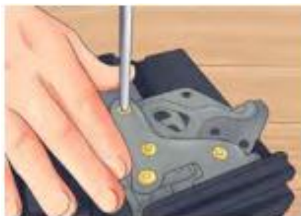
รูปที่ 10 ใส่อุปกรณ์การติดตั้งถ้ายังไม่มีประสบการณ์ในการติดตั้ง

2. ใส่อุปกรณ์การติดตั้งถ้ายังไม่มีประสบการณ์ในการติดตั้ง ให้ทำ ตามขั้นตอนในคู่มือ ซึ่งโดยทั่ว ๆ ไปเป็นแค่การ ติดอุปกรณ์เข้ากับแผ่นยึด เครื่องเสียง กดลงไปบริเวณใกล้เคียงกับช่องใส่สกรูขณะไขเพื่อให้แน่ใจ ว่าแผ่นยึดจะอยู่ในตำแหน่งที่ถูกต้อง