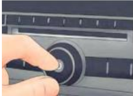
รูปที่ 14 ทดสอบเครื่องเสียงรถยนต์

6. ทดสอบเครื่องเสียงรถยนต์ เปิดเครื่องเสียงรถยนต์และลอง ระบบวิทยุ AM และ FM รวมทั้งการเล่นแผ่นซีดี ทดสอบการตั้งค่า ความดังและบาลานซ์ของเสียง เพื่อให้แน่ใจว่าใช้งานกับลำโพงได้ปกติ เมื่อแน่ใจแล้วก็ปิดเครื่องเสียง