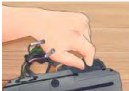
รูปที่ 11 ต่อเข้ากับระบบไฟฟ้า

4. ต่อสายดิน - ถ้าเป็นชุดสายไฟ สายดินจะเชื่อมต่อเมื่อเสียบชุดสายไฟเข้าด้วยกัน - ถ้าไม่ได้เป็นชุดสายไฟ จะต้องหาซื้อต่อ สายไฟ และสกรู ที่ใส่อยู่กับโครงรถหรือแฮชชี คลายเกลียวออกแล้วสอดสายดิน (ปกติจะมีสีดำ) เข้าไปข้างใต้แล้วค่อยไขกลับให้แน่น - คำนี้ขึ้นอยู่กับว่าการต่อสายดินจะสำคัญมากต่อคุณภาพเครื่องเสียง ถ้าสายดินไม่ได้ เชื่อมต่ออยู่กับโครงเหล็กเปลือย มันจะไม่ทำงาน และถ้าหากไขไม่แน่นพอ อาจจะทำให้เสียงที่ได้ ออกมาไม่ดีสามารถนำกระดาษทรายมาขัดบริเวณนั้น เพื่อให้แน่ใจว่าเชื่อมต่อได้อย่าง