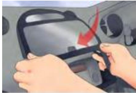
รูปที่ 17 ใส่กรอบหน้าบริเวณเครื่องเสียง

3. ใส่กรอบหน้าบริเวณเครื่องเสียงกลับเข้าไปเหมือนเดิม ตรวจสอบอีกครั้งว่าสกรูและกรอบทุกอย่างอยู่ในลักษณะที่ถูกต้อง ของมัน