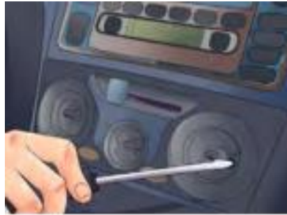
รูปที่ 2 ไขสกรูทุกตัว

2. ไขสกรูทุกตัวที่ยึดกรอบหน้าที่ครอบเอาไว้ออก ตรวจสอบ ให้ดีทุกครั้งว่าไขสกรูออกครบทุกตัวแล้ว มิฉะนั้น อาจเสียหายได้