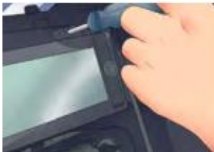
รูปที่ 16 ประกอบส่วนต่างๆ

2. ประกอบส่วนต่างๆ กลับเข้าไปเหมือนเดิม ใส่สกรูกลับเข้าไป ที่เดิมเพื่อล็อกให้เครื่องเสียงอยู่กับที่ ต่อสายไฟให้เป็นเหมือนเดิม และ ใส่ปุ่มกดหรือลิ้นชักที่ถอดออกมากลับเข้า