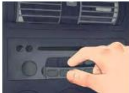
รูปที่ 18 ลองเครื่องเสียงตัวใหม่

4. ลองเครื่องเสียงตัวใหม่ ปิดกุญแจให้มีไฟฟ้าเข้าหรือสตาร์ทรถ อีกครั้ง และลองเล่นเครื่องเสียงดูรวมทั้งการตั้งค่าต่าง ๆ ต้องแน่ใจว่า ทุกอย่างสามารถทำงานได้อย่างปกติ