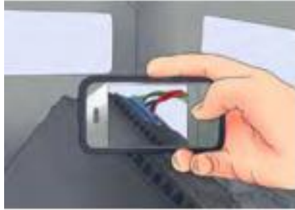
รูปที่ 7 ถ่ายรูปแบบการเชื่อมต่อสายไฟเข้ากับเครื่องเสียง

7. ถ่ายรูปแบบการเชื่อมต่อสายไฟเข้ากับเครื่องเสียง นี่เป็น ขั้นตอนที่สำคัญเพราะรูปภาพที่ถ่ายไว้จะช่วยให้ต่อวงจรเครื่องเสียง ชุดใหม่ได้ถูกต้อง