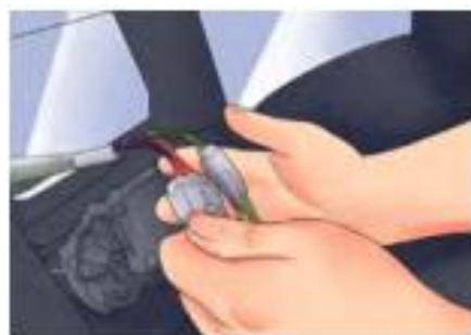
รูปที่ 12 ต่อสายดิน

4. ต่อสายดิน - ถ้าเป็นชุดสายไฟ สายดินจะเชื่อมต่อเมื่อเสียบชุดสายไฟเข้าด้วยกัน - ถ้าไม่ได้เป็นชุดสายไฟ จะต้องหาซื้อต่อ สายไฟ และสกรู ที่ใส่อยู่กับโครงรถหรือแฮชชี คลายเกลียวออกแล้วสอดสายดิน (ปกติจะมีสีดำ) เข้าไปข้างใต้แล้วค่อยไขกลับให้แน่น - คำนี้ขึ้นอยู่กับว่าการต่อสายดินจะสำคัญมากต่อคุณภาพเครื่องเสียง ถ้าสายดินไม่ได้ เชื่อมต่ออยู่กับโครงเหล็กเปลือย มันจะไม่ทำงาน และถ้าหากไขไม่แน่นพอ อาจจะทำให้เสียงที่ได้ ออกมาไม่ดีสามารถนำกระดาษทรายมาขัดบริเวณนั้น เพื่อให้แน่ใจว่าเชื่อมต่อได้อย่าง