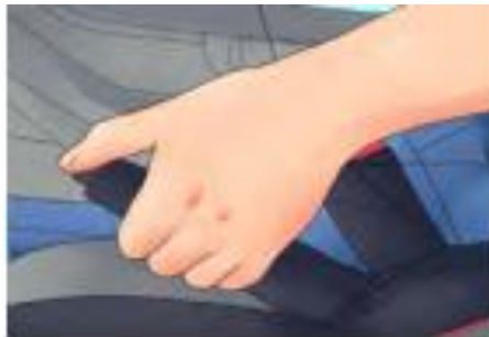
รูปที่ 1 ดึงเบรกมือขึ้น